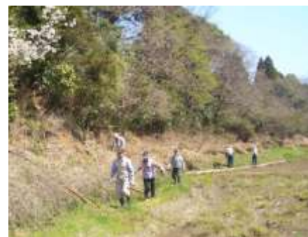
3/15 美しい景色が出現