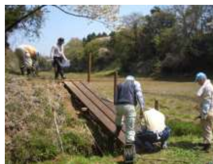
4/11 木道を試験的に造ってみました