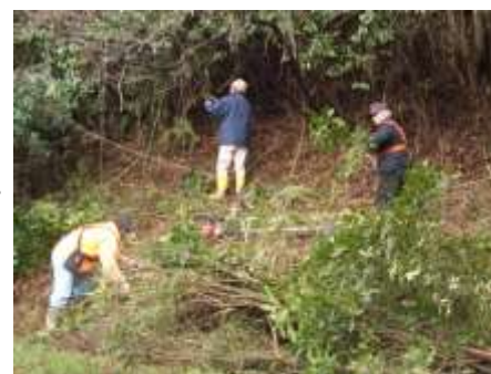
3/7 着々と伐り進んで行くと...