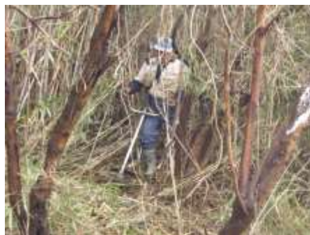
3/7 最大の難所の伐り倒し作業

天神谷津のホタル発生地への、進入路整備に着手しました。人の背丈以上もある篠竹などを伐り倒したところ、美しい雑木林が姿を現し、思わぬ成果に、今後の整備への意欲が湧き上がりました。併せて木道も試験的に一部分設置してみました。ホタル シーズンまでの完成を目指します。