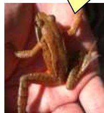
林床から春を告げるシュラン

ゲンジボタルやヘイケボタルの生息する谷津田や中央公園の環境整備のための草刈り作業を、下記の日程で実施します。軍手、長靴以外の必要器材等は準備します。なお、集合場所等でご不明な点は担当理事に直接お問い合わせ下さい。会員の皆さまのご協力をよろしくお願いいたします。