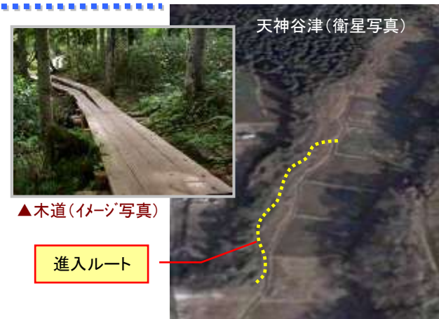
▲木道(イメージ写真)