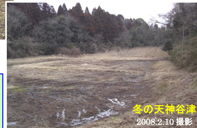
冬の天神谷津 2008.2.10 撮影