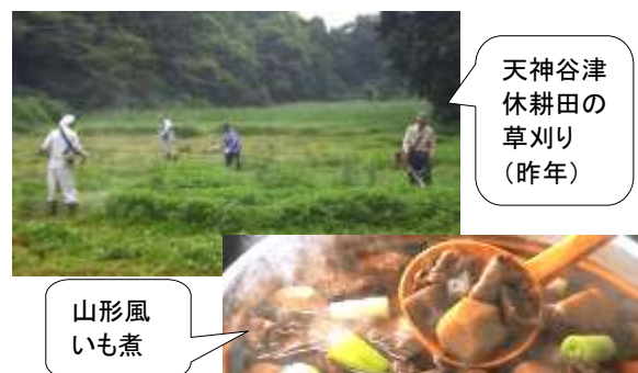
天神谷津 休耕田の 草刈り (昨年)